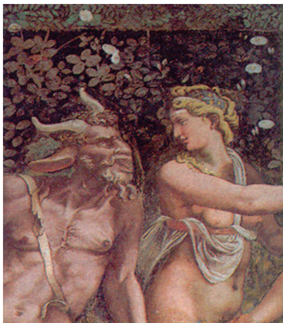
Ninfa y sátiro, detalle de un fresco de la época del Renacimiento, obra del arquitecto y pintor italiano Giulio Romano, en francés Jules Romain (Roma, 1492 o 1499 – Mantova, 1546). Colaboró con Rafael (Loges du Vatican), construyó y decoró el palacio del Te para Federico de Gonzaga en Mantua, Italia (1524 – 1530).

El mito sería, según esta hipótesis de trabajo, una imbricación entre fragmentos de relato reales y fragmentos de relatos ficticios o imaginarios. Existiendo partes del relato que juegan un rol de bisagras entre el primero y el segundo, por ello son elementos que contienen en su naturaleza lo real y lo ficticio. Un ejemplo de personajes que habitarían en estas zonas bisagra (intersecciones de círculos y rectángulos, en color blanco, en el Gráfico N° 1) podrían ser los sátiros , divinidades o semidioses, campestres y rústicos, compañeros de Dionisos, en la mitología griega (y también romana, conocido como Baco) habitantes de los bosques que pasaban su tiempo persiguiendo a las ninfas, bebiendo vino, danzando y tocando la siringa, la flauta o la gaita. Se les representa con cuernecillos, patas y rabo de macho cabrío. El más famoso es Sileno, el mayor de los sátiros, hijo de Hermes, mensajero de los dioses, o de Pan, dios de los bosques. Tutor del joven dios Dionisos, Sileno