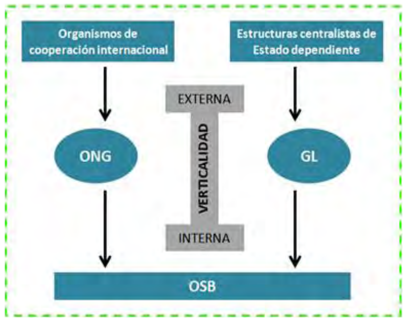
Figura 02: Niveles de la relación vertical