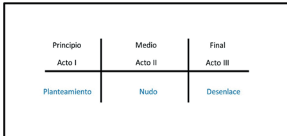
Figura 3. La Estructura Aristotélica

Un relato que sigue estas etapas en su estructura narrativa tiene todo lo necesario para funcionar. Pero ¿por qué es que esta estructura aristotélica es tan efectiva?, simplemente porque nuestro cerebro funciona así, estamos programados para procesar la información de esta manera, con esta estructura. Desde niños, las historias que hemos escuchado han estado estructuradas de esa forma y eso ha moldeado a nuestro cerebro para procesar los relatos de ese modo.