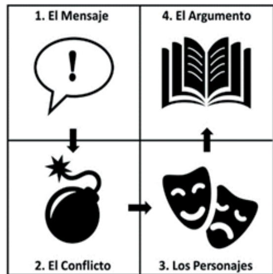
Figura 2. Los cuatro elementos del Storytelling