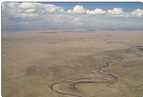
Figura 5 a

no circulaba lo que motivó un informe de la ONERN-CORPUNO 26 del 1965 (cit. por Flores Ochoa y Paz Flores, 1986 pp. 33-34) y es una clara demostración de supina ignorancia de los “técnicos”: “El microrelieve está conformado por una sucesión de depresiones o micro-hoyos alternados con suaves y pequeñas elevaciones. El sistema de drenaje, en general es imperfecto”.