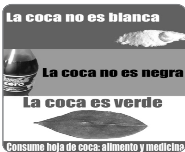
Figura 4 Hoja de coca

variedad de muña de hojas pequeñas, y que luego la huelan, lo rechazan como si se tratase de cocaína y su inhalación. Ése es uno de los mayores daños que la cultura occidental le ha hecho a nuestro patrimonio. Ahora se revaloriza la muña porque laboratorios de Suiza y Austria le han descubierto cualidades terapéuticas maravillosas, que trascienden las digestivas. Pero la realidad es que conserva la carne; mantiene semillas de granos impidiéndoles germinar; conserva más tiempo la turgencia de la papa y otros tubérculos, incluso en el proceso de elaboración y cocción del chuno. No obstante, no he visto al señor Gastón Acurio, aventurarse, culinariamente, y usar esta hierba maravillosa, abusando, en cambio del conocido huacatay ( Tagetes minuta ) sabroso, aunque algo fuerte para la digestión, y es muy buen pesticida y preservante. Pero este señor, se olvida (o desconoce) que existe el chincho ( Tagetes elíptica ): igual género, diferente especie y con sabor muy similar, en uso culinario y como preservante, pero con menos efectos colaterales.