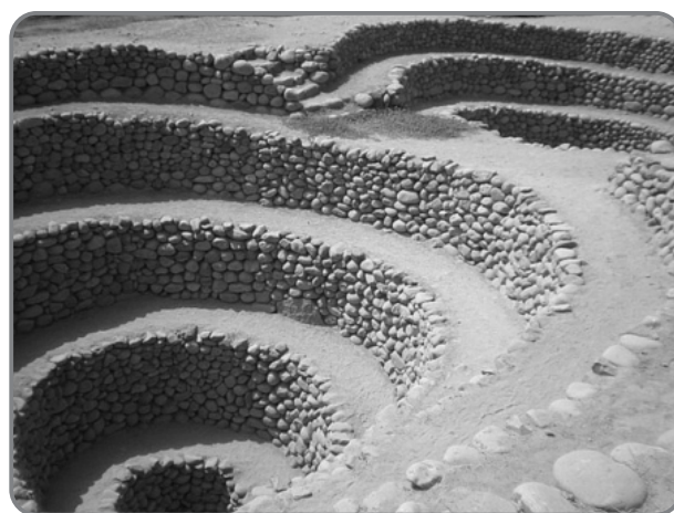
Ñabuñpuquio u ojo de agua en Nazca

como cerros escarpados con andenes (Kendall, 2008 y 2011 y Kendall y Rodríguez, 2009) o en altitudes sobre los 3800 msnm con los waru waru o camellones y las cochas , en altitudes superiores a los 4000 msnm (De Vries, 1986; Earls, 1986; Erickson, 1986; Flores Ochoa y Paz Flores, 1986; Rozas, 1986) o en uno de los máximos logros agrícolas, aún practicado en algunas regiones - pero que se pierde por el despoblamiento del campo- como son las amunas o siembra y cosecha de agua para su uso en andenes (Apaza, Alencastre y Arroyo, 2006 y Kendall, 2011) en la sierra, o para su utilizarla en galerías filtrantes o ñabuñpuquios o en chacras hundidas o llanchas , en la costa (Rodríguez, 2006), se deben recuperar y lograr el desarrollo. (Figs. 1a y 1b)