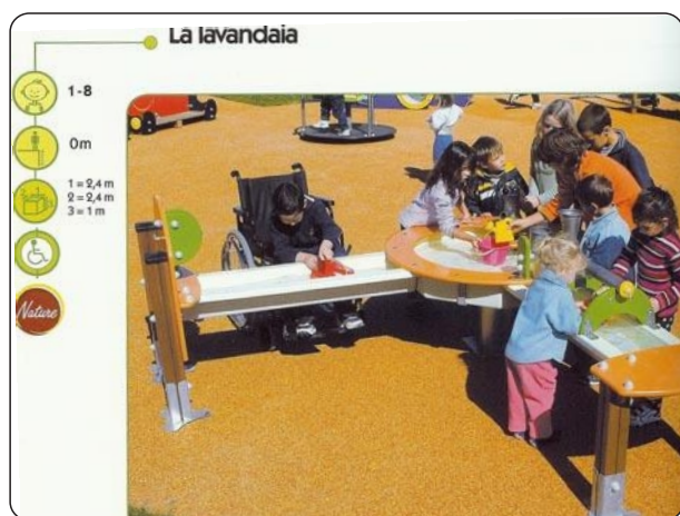
Figura 3: La lavandería, juego con agua