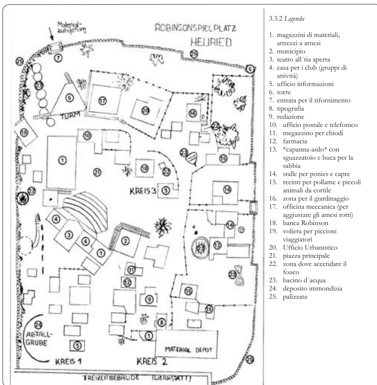
Figura 4: Esquema de un parque Robinson, Gustav Mugglin.

función: quienes se ocupan de mantener los instrumentos de trabajo; quienes, de crear e imprimir el periódico Robinson; quienes, del jardín; quienes, del teatro... Lo cierto es que todo desde el principio es administrado a través de una asamblea que se reúne cada semana para discutir los problemas que se presentan y cómo resolverlos. Importante juego de imitación.