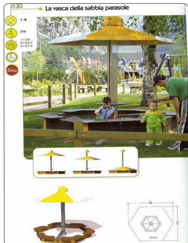
Figura 2: Arenero con sombrilla