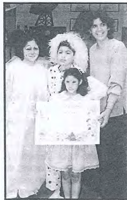
La directora de Maricarmen con niños de su centro.

El Centro es uno de los pocos que brinda a los alumnos con necesidades educativas especiales la posibilidad de ser integrados en aulas de educación inicial regular, ofreciendo a los alumnos con alguna dificultad la oportunidad de tener buenos modelos, de sentirse aceptados por los de-