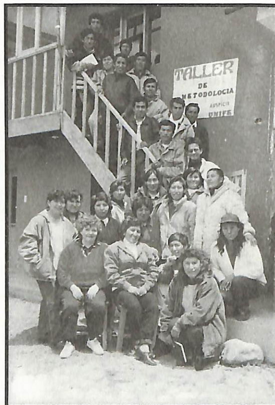
Participantes del Taller de Capacitación "Metodología Activa para la Educación Primaria"

A través del apoyo a actividades como ésta, la Unifé renueva su compromiso positivo de construir el Perú, mediante un trabajo de paz, armonía y solidaridad cristiana.