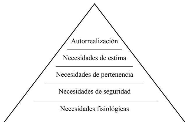
Figura 2 Pirámide de necesidades de Maslow (1968)

La escuela Humanista, más centrada en el análisis de la conducta y la cognición de sujetos considerados sanos y adaptados socialmente, hace especial hincapié en las relaciones sociales como factor determinante en el estado de bienestar del sujeto. Es un hecho que pasamos gran parte de nuestro tiempo en interacción con los demás, siendo la relación que mantenemos con nuestros semejantes fuente de bienestar o bien fuente de estrés. Dependiendo de las habilidades que pongamos en marcha podremos modular la relación que mantenemos con el entorno.