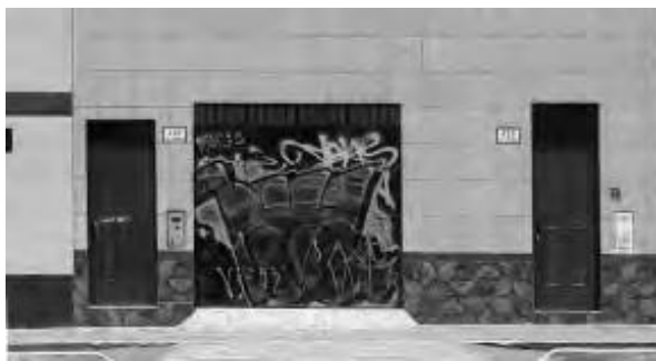
Detalle del grafiti

También es llamado de atención, alerta. Donde hay una firma aparecen otras. El parabrisas del auto con polvo es útil para escribir, lugar de primeros entrenamientos del futuro grafitero. Progresivamente afirma