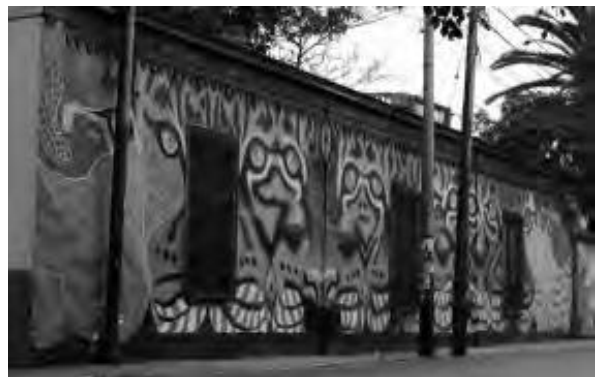
Grafitis en el distrito de Barranco, Lima, Perú.