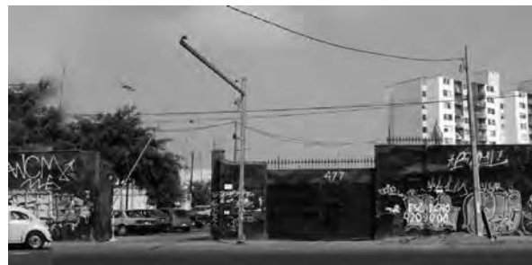
Cerco de un edificio en construcción en av. Colonial, Cercado de Lima.

En este caso, no hay esa necesidad, tampoco la exigencia de la autoridad y los cambios se dan por la inercia de la dinámica social, tal vez por ahí está la explicación a este espíritu de búsqueda de expresión libre en el imaginario ciudadano pero concreta en el caso del grafitero.