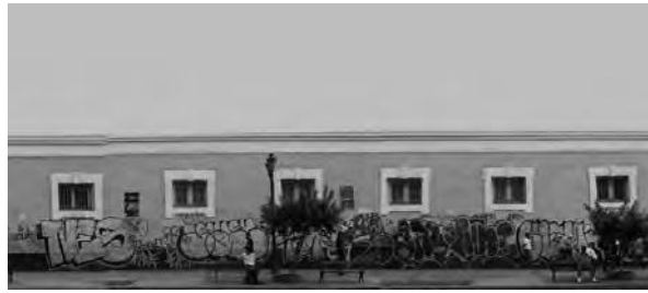
Densidad de grafitis en la pared.

Algo interesante se nota en esta edificación: conforme las expresiones se van acercando a la avenida principal (av. Alfonso Ugarte), más cerca del lugar visible, las intervenciones disminuyen, reducen su tamaño, son más fugaces y progresivamente van desapareciendo al llegar a la esquina. El carácter clandestino se pone de manifiesto con claridad en este escenario cuando vemos que en la fachada principal prácticamente no existen pintas. Lo que sí aparece es la intervención de la fachada de manera oficial con banners transitorios, pero intervención al fin, que producen cierto nivel de contaminación visual. Y finalmente, este degradado de la intervención de las fachadas por los grafiteros desaparece totalmente en la calle lateral, la explicación es muy sencilla: al frente está ubicado el edificio de Seguridad del Estado, un lugar que representa el orden y, precisamente, lo contrario a lo que el pensamiento espontáneo, por decir lo menos, de este tipo de expresiones urbanas.