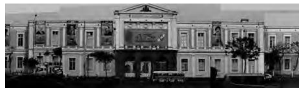
Fachada del centro educativo.