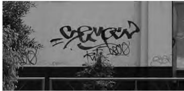
Grafiti de firmas en las paredes del Colegio Bartolomé Herrera.

élite como una forma de reclamo de esa inclusión esperada.