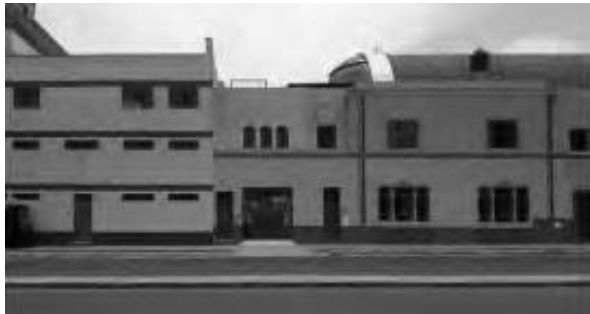
Vista general de fachada en av, Colonial, cuadra 4.

Se trata de marcar los espacios con la firma. Ahí donde no hay presencia de propiedad hay vulnerabilidad del espacio. No es necesariamente propio de las zonas marginales de la ciudad. Basta que exista un lugar desprotegido para ser intervenido.