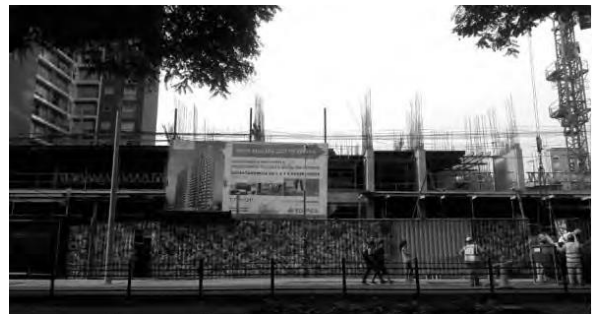
Construcción en av. José Pardo, Miraflores, Lima, Perú.

Con mayor razón, los espacios explícitamente desechables son propicios para estas expresiones como formas de estocada final de lo que será el pasado, una especie de epitafio transitorio a lo que fue abandonado para dar lugar, en este caso, al edificio nuevo. Una especie de exigencia social, de aviso que ahí se producirá un cambio drástico de la ciudad a diferencia de otras zonas de la ciudad donde las nuevas construcciones, incluso sabiendo que habrá una nueva edificación que mejorará el escenario urbano, las constructoras se ven obligadas a poner cercos transitorios con cierta decoración "decente" mientras dura la construcción de la obra.