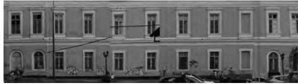
Disminución progresiva de los grafitis al acercarse a la vía principal.