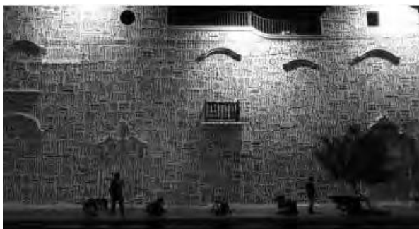
Grafiti en la fachada del Centro Cultural de España

La decisión de las instituciones por generar una relación armoniosa con estos grupos, algunas veces ha propiciado acciones dotando de espacios para estas expresiones. Esto ha conllevado una discusión sobre el carácter contestatario del grafiti. En cualquier caso, bajo el auspicio formal se ha intervenido el espacio sabiendo de lo efímero de su existencia, aspecto que define la naturaleza del grafiti. Naturaleza que evoluciona de acuerdo con el itinerario histórico de la cultura de las sociedades, materializadas, en este caso, principalmente en las ciudades.