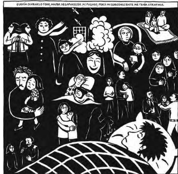
Satrapi, Marjane (Persépolis 3, "La Legumbre" – pag.44)

la expresión". Por otra parte, la lealtad hacia los principios que Sennet considera como una carencia actual se encarna particularmente en el discurso de la abuela que es una influencia determinante para la protagonista (24).