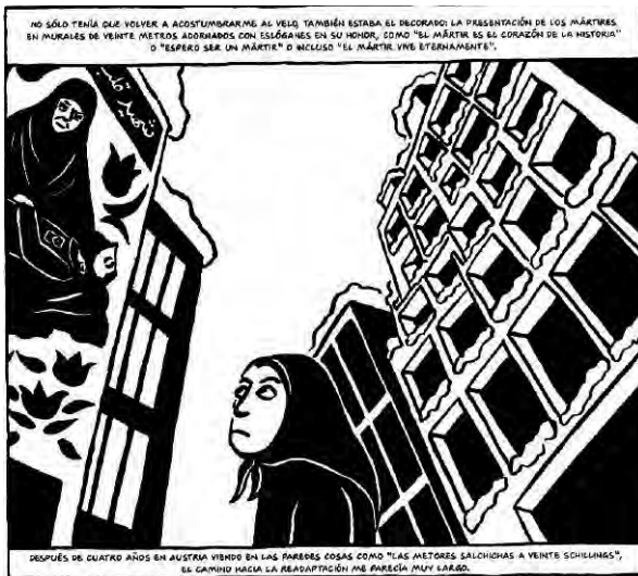
Satrapí, Marjane (Persépolis 4, “El Retorno” – pag.5)

El relato presenta una visión contrapuesta entre el mundo oriental (Irán) y el occidental (Viena y Francia). Si bien no idealiza al Occidente y, por el contrario, denuncia algunos aspectos decadentes, sí lo muestra como el mundo de las posibilidades, la libertad y mayor racionalidad. En cambio, Oriente se presenta como el lugar del atraso en la idiosincrasia, del fanatismo religioso, dictadura, falta de libertad, recorte de las posibilidades y opresión de la mujer. Hasta cierto grado, Occidente constituiría el modelo hegemónico que cuenta con las condiciones necesarias para vivir: la protagonista termina migrando a Francia porque la situación en su país es percibida como “invivable”.