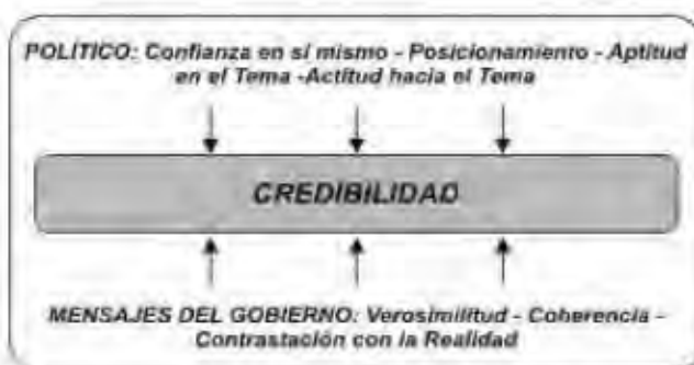
Figura 3 Credibilidad de los políticos y del gobierno

La credibilidad está relacionada con los medios de comunicación (credibilidad del canal o medios de comunicación) como con las personas concretas que trabajan en medios de comunicación como presentadores de noticias de TV y columnistas, etc. que dicen la verdad como líderes de opinión para la mente de audiencia (fuente credibilidad). Pero credibilidad depende del desempeño de los propios medios de comunicación. Y en el caso del gobierno depende en parte de los mensajes que presente, así como de su verosimilitud, coherencia y de la contrastación con la realidad que hagan los perceptores. Es por ello que por más dinero que gaste un gobierno para demostrar que la realidad es una, los hechos dicen lo contrario y la credibilidad disminuye. Ello ocurre por ejemplo en el caso de las ciudades prácticamente destruidas por el terremoto de 2007. La propaganda oficial muestra lo reconstruido, pero la información de los medios y la propia realidad dicen que las cosas no son así. En países como el Perú, cuando algunos Gobierno han disminuido su credibilidad por cualquier razón, las personas perciben como más confiables a los medios con una opinión política opuesta.