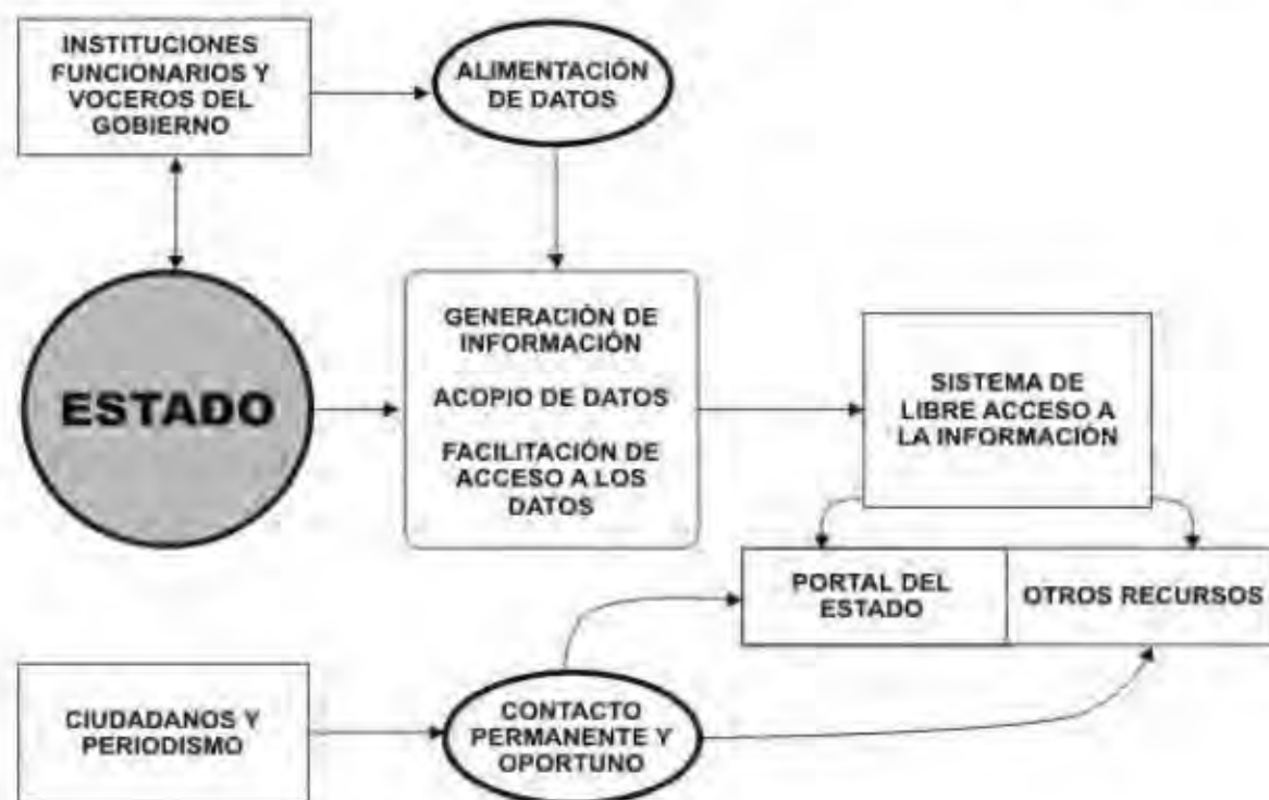
Figura 2 Sistema de libre acceso a la información del Estado

El acceso a las fuentes de información de los gobiernos hace factible entender con precisión las acciones, decisiones y disposiciones vinculadas con el Estado. Su descripción y explicación, tanto como el análisis y la opinión respectiva solamente son factibles en tanto se cuente con los datos suficientes en el momento oportuno, para construir un discurso periodístico confiable en cualquiera de los géneros o para que el ciudadano pueda estar enterado de la manera en que se maneja el estado, tal como lo establecen la Constitución Política del Perú y la Ley