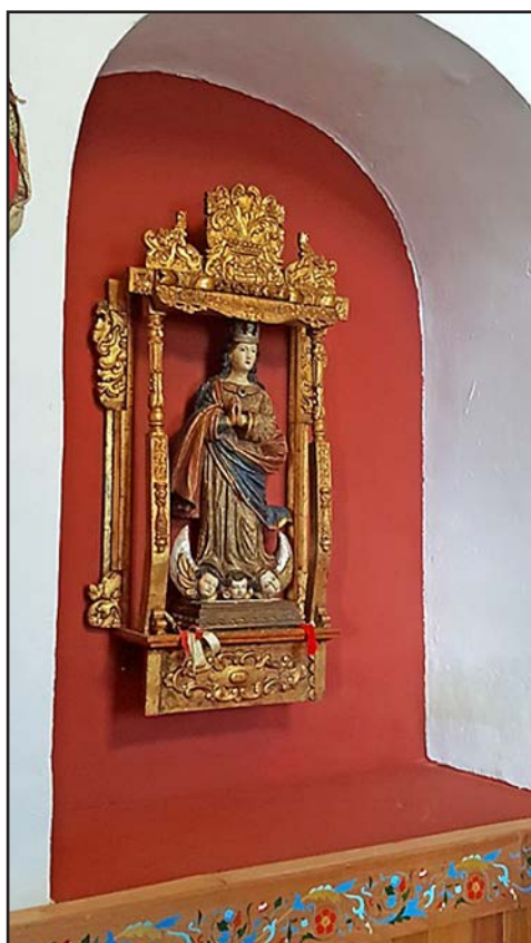
Figura 12. Capilla de la Casa Hacienda Shismay. Espacio que forma parte del Museo