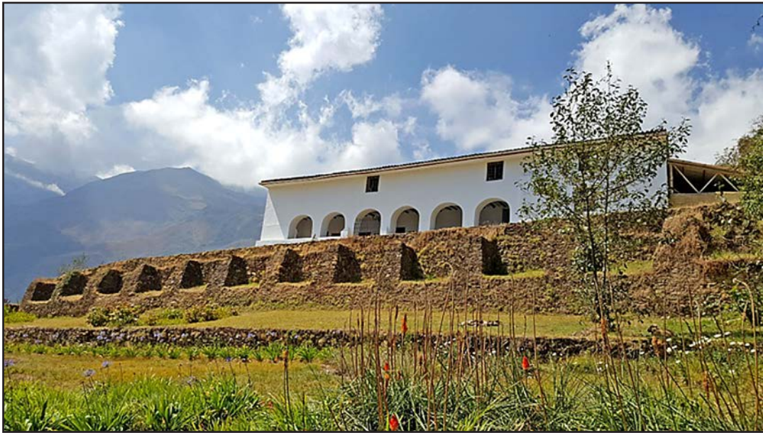
Figura 5. Casa Hacienda Shismay en la actualidad