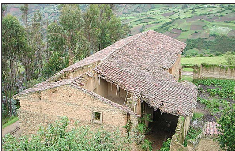
Figura 3. Casa Hacienda Shismay, en mal estado de conservación, debido al abandono de esta