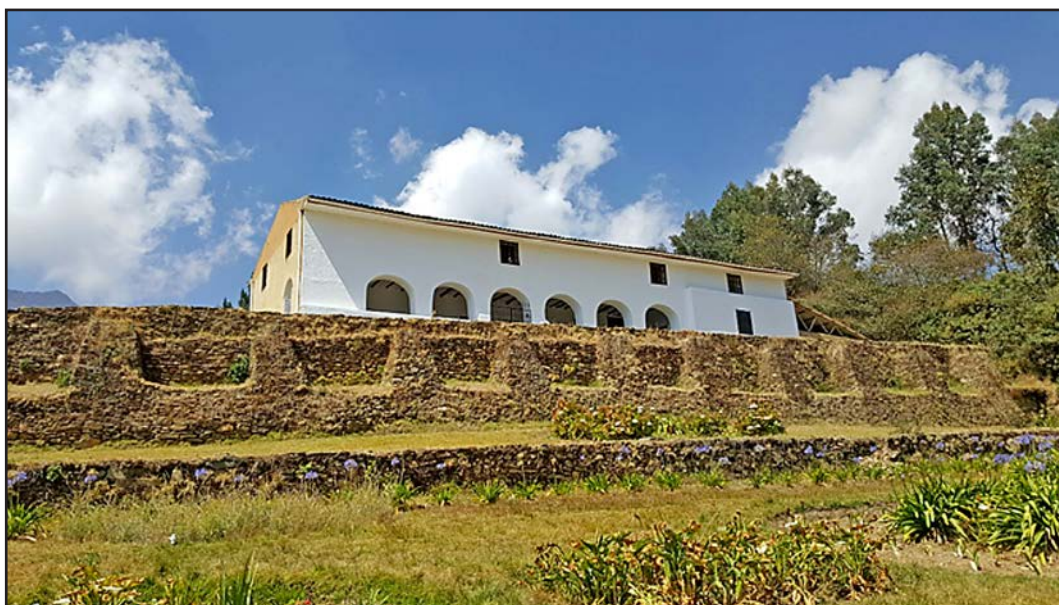
Figura 4. Casa Hacienda Shismay en la actualidad

El 25 de mayo del 2016 el “Museo Casa Hacienda Shismay” pasa a formar parte de la Red de Museos del Perú. Este museo además de mostrar el rol de las casas haciendas por más de 400 años como centros económicos, políticos y religiosos, está dedicado a estudiar el tema de las tenencias de tierras en el Perú, tema poco conocido y estudiado.