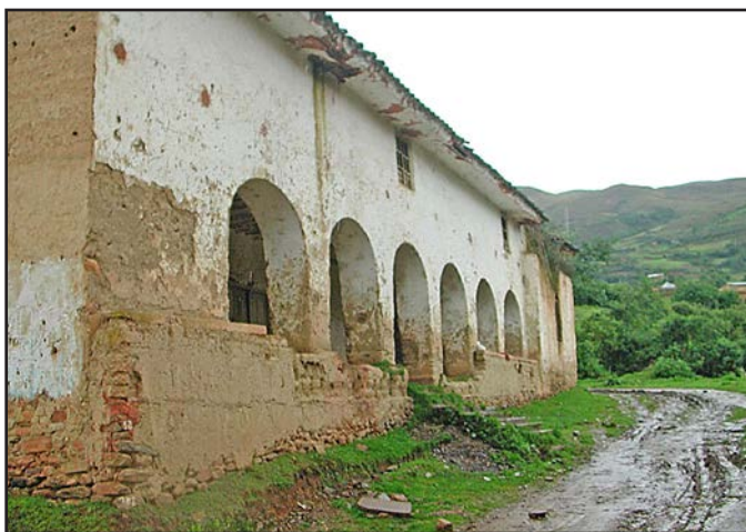
Figura 2. Casa Hacienda Shismay, en mal estado de conservación, debido al abandono de esta

A lo largo de los años, la Casa Hacienda Shismay sufrió los embates de la naturaleza y la falta de mantenimiento. Gracias a una generosa donación privada, en marzo de 2005 empiezan los trabajos de restauración para fines turísticos y culturales.