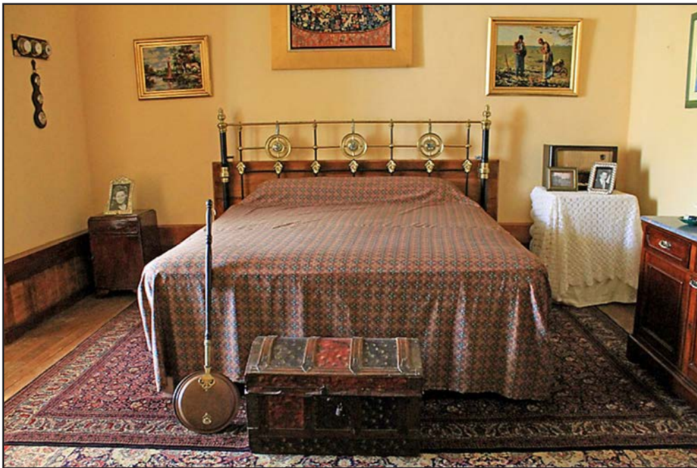
Figura 8. Habitación principal. Espacio que forma parte del Museo