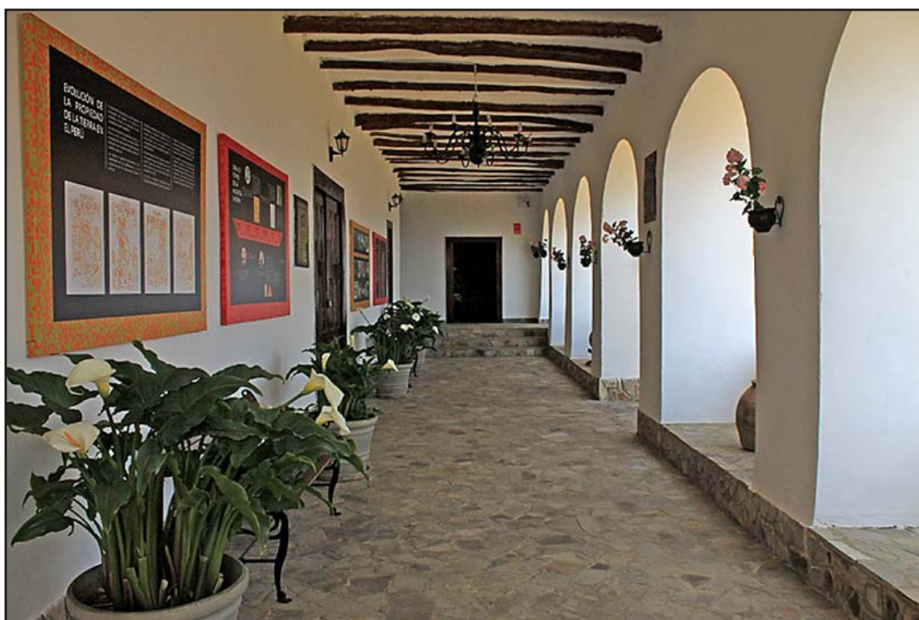
Figura 7. Corredor interno con arquería. La puerta posterior lleva a la capilla