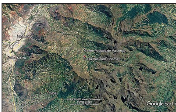
Figura 1. Ubicación de la Casa Hacienda Shismay, en relación con la ciudad de Huánuco.

La Casa Hacienda Shismay se encuentra ubicada en el Centro Poblado San Sebastián de Shismay, distrito de Amarilis, provincia y región Huánuco a 17 km. de la ciudad de Huánuco.