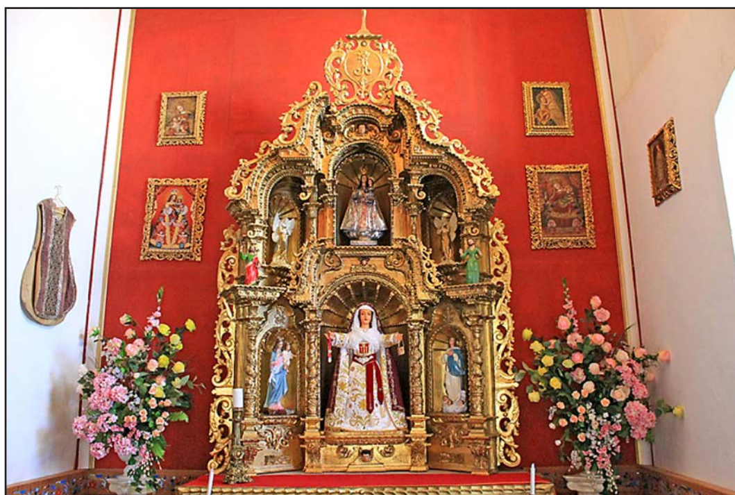
Figura 11. Capilla de la Casa Hacienda Shismay. Espacio que forma parte del Museo