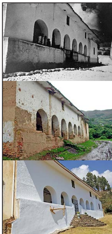
Figura 13. La Casa Hacienda Shismay en tres momentos históricos, en el año 1958, cuando se encontraba en mal estado de conservación, y en el año 2016.

La Casa Hacienda Shismay, en la actualidad se encuentra totalmente restaurada, la misma que brinda diversos servicios turísticos y culturales a la población del