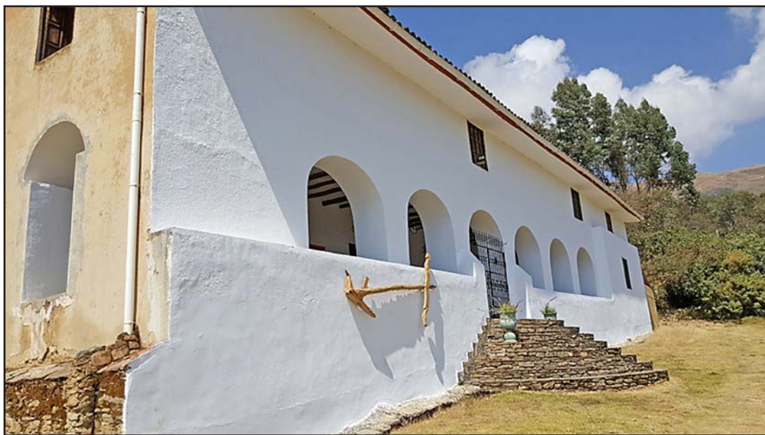
Figura 6. Fachada principal de la Casa Hacienda Shismay en la actualidad