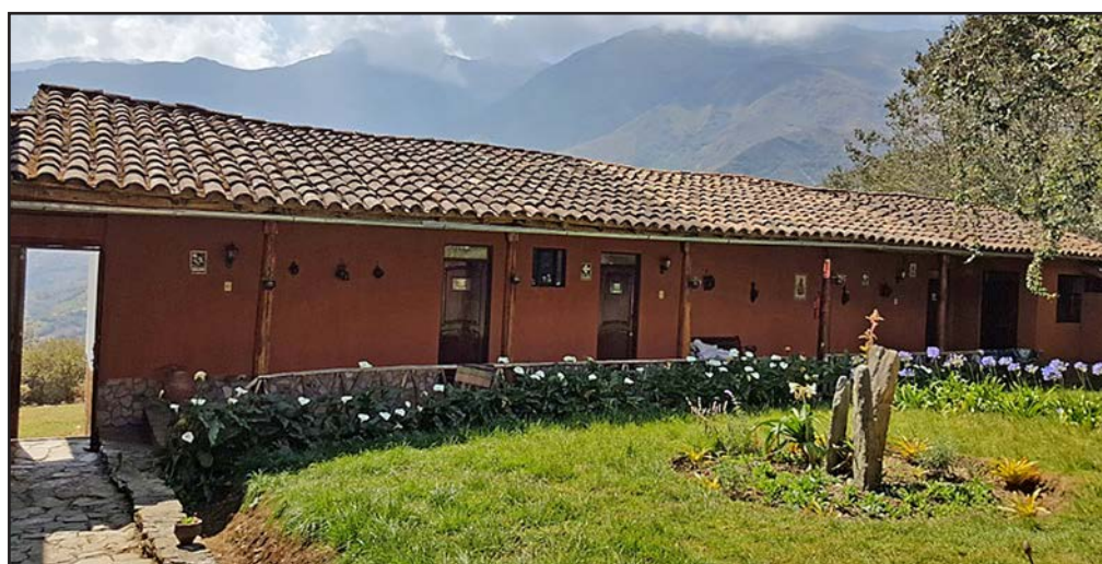
Figura 14. Zona de hospedaje de la Casa Hacienda Shismay

lugar y a los visitantes, ya que cuenta con hospedaje, servicios de alimentación y visitas guiadas.