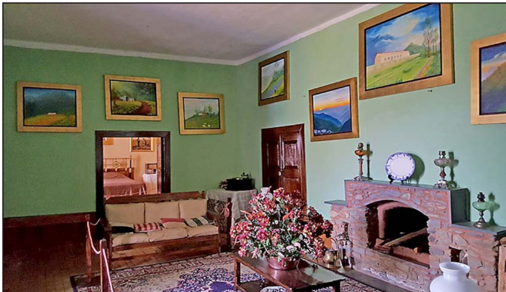
Figura 9. Sala de la Casa Hacienda Shismay. Espacio que forma parte del Museo