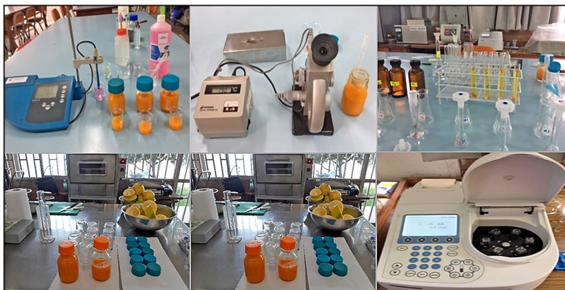
Figura 1. Análisis Físicoquímicos, Bioactivos

Se utilizó la metodología de la AOAC 967.21 Cap.45, pp. 21-22, 21th Edición 2019. Se acondicionó una solución de 2,6-diclorofenolindofenol a 400 ppm, se aplicó en la titulación de 5 ml de cada una de las muestras, que habían sido previamente diluidas en 20 ml de ácido oxálico al 2%, para obtener un color rosado suave que permanece constante. Se tituló 0,2 ml de una solución patrón de ácido ascórbico 0,2 % (p/v) y 0,2 ml de agua destilada empleada como blanco. Los resultados se expresaron en mg de vitamina C por 100 g de muestra (Heldrich, 1990).