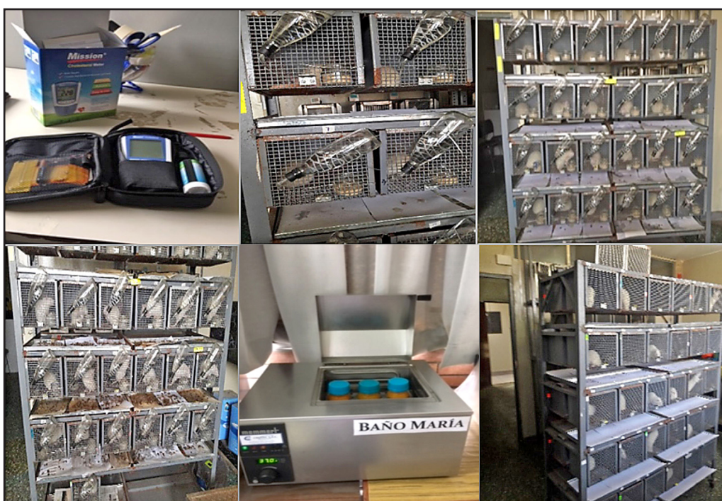
Figura 2. Trabajo en el Bioterio de la UNALM

jaulas metabólicas limpias y desinfectadas para 24 ratas, con bebederos y comederos al interior de las jaulas metabólicas, se identificó con sticker, codificando las jaulas que corresponden al grupo control y a los grupos experimentales, de ingesta del extracto de maracuyá de 1.5 y 3 ml respectivamente (ver Figura 2).