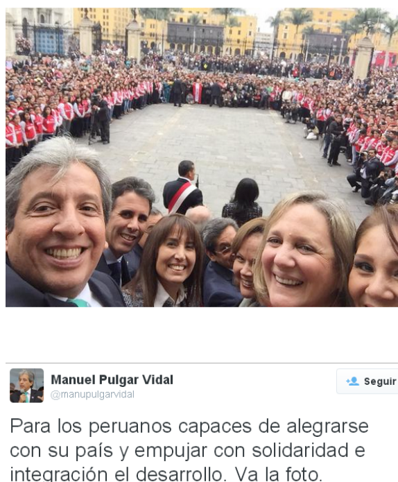
Figura 2. El Tuit del Ministro

Sin embargo, hay selfies que han generado un marcado rechazo y generado polémica inclusive antes de su publicación. El 28 de julio de 2015, luego del último mensaje a la nación de su gobierno, el Presidente Ollanta Humala daba un discurso en el frontis de Palacio de Gobierno acompañado por sus ministros y su esposa. Mientras ello ocurría, el Ministro del Ambiente Javier Pulgar Vidal se entretenía tomándose un selfie con otros ministros frente a las cámaras de TV. Los comentarios no se hicieron esperar tanto en los medios como en las redes sociales. Días después, el Ministro lo publicó en su cuenta de Twitter (Figura 2).