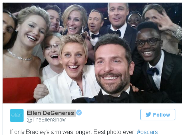
Figura 1. El tuit más retuiteado de la historia

que pueden parecer increíbles. El que fuera registrado por la conductora Eleen DeGeneres durante la ceremonia de entrega del Oscar 2014 y colgado en Twitter en vivo logró más de un millón de retuits en 50 minutos y es, hasta el momento, el más retuiteado de la historia (Figura 1). En ese momento, DeGeneres tenía más de 13 millones de seguidores que al 4 de setiembre de 2015 alcanzan 47,111,339.