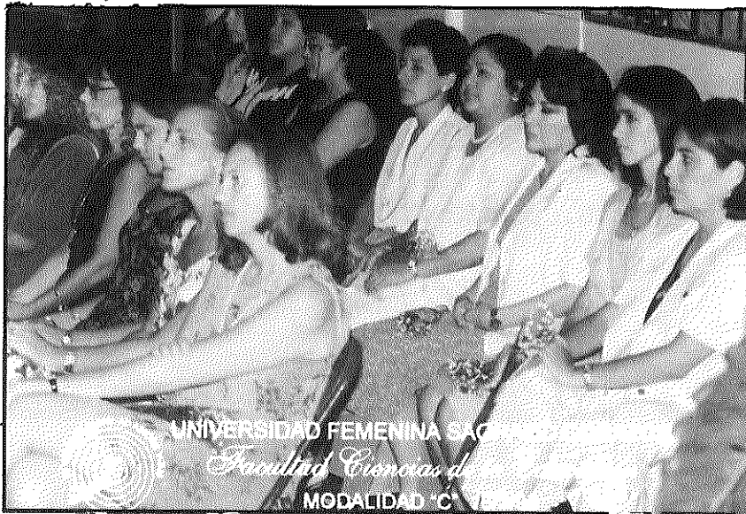
Licenciadas formadas en la UNIFE para el tercer milenio

con el medio ambiente y la salud, la educación en materia de población y la educación para la comprensión de valores y culturas diferentes.