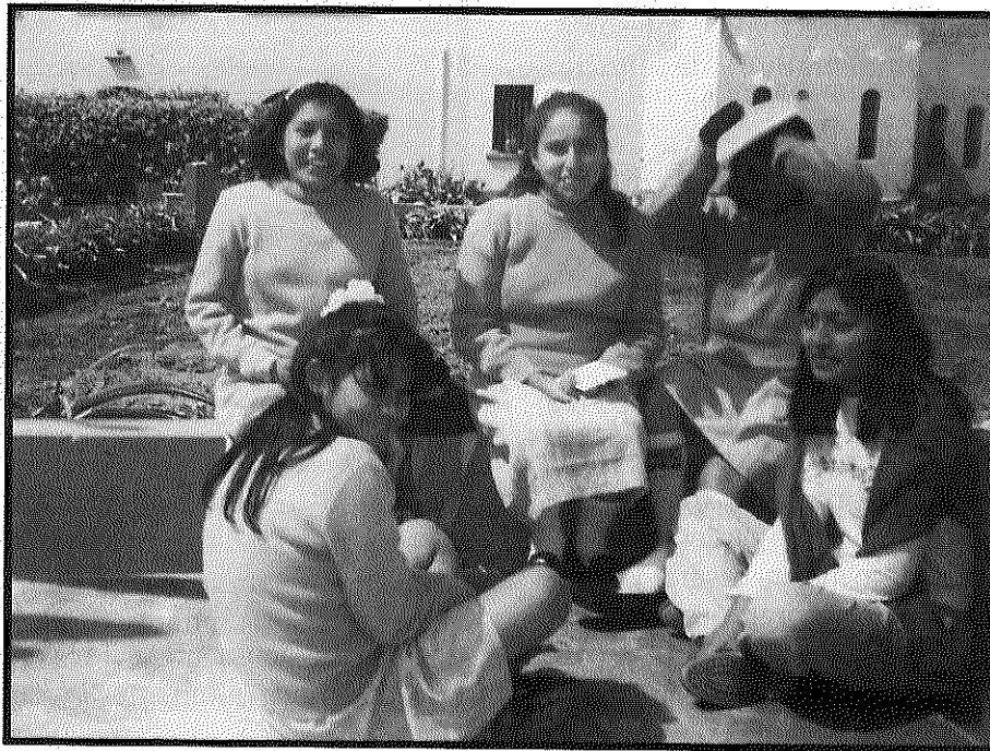
Niñas del Hogar Santa Isabel

Por lo general, las personas que se acercan a la institución con el ánimo de ayudar, suelen experimentar a la salida, una gran satisfacción, se van más enriquecidas que vinieron y más que a dar, se podría decir, que se viene a recibir.