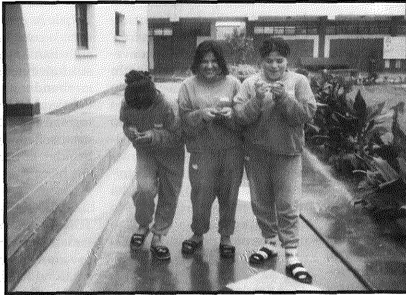
Niñas del Hogar Santa Rosa