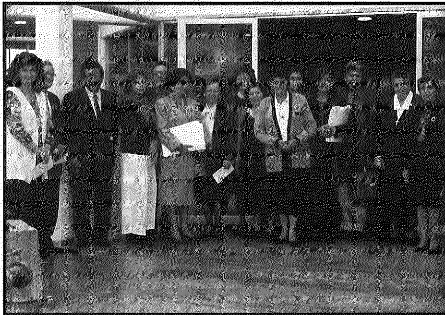
Un clima institucional positivo es fundamental para la gestión de un proyecto educativo.

Este concepto del clima educativo es mencionado por Santa Magdalena Sofía Barat en sus escritos en forma reiterada y han sido tomados en cuenta por las religiosas del Sagrado Corazón, como uno de los aspectos esenciales de la educación en sus obras educativas.