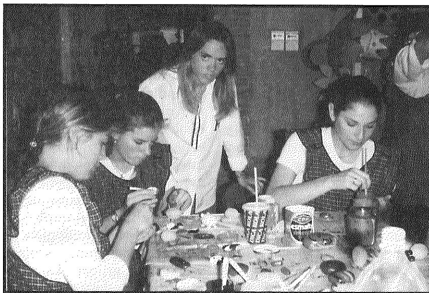
La tecnología educativa aporta diversos modelos para la enseñanza - aprendizaje

Otra línea, fundamental, para el desarrollo de la tecnología educativa es la del Aprendizaje. Se ha caminado de un enfoque conductista al cognitivista y, luego, al constructivista. Cada concepción del aprender tiene implicancias sustantivas en las