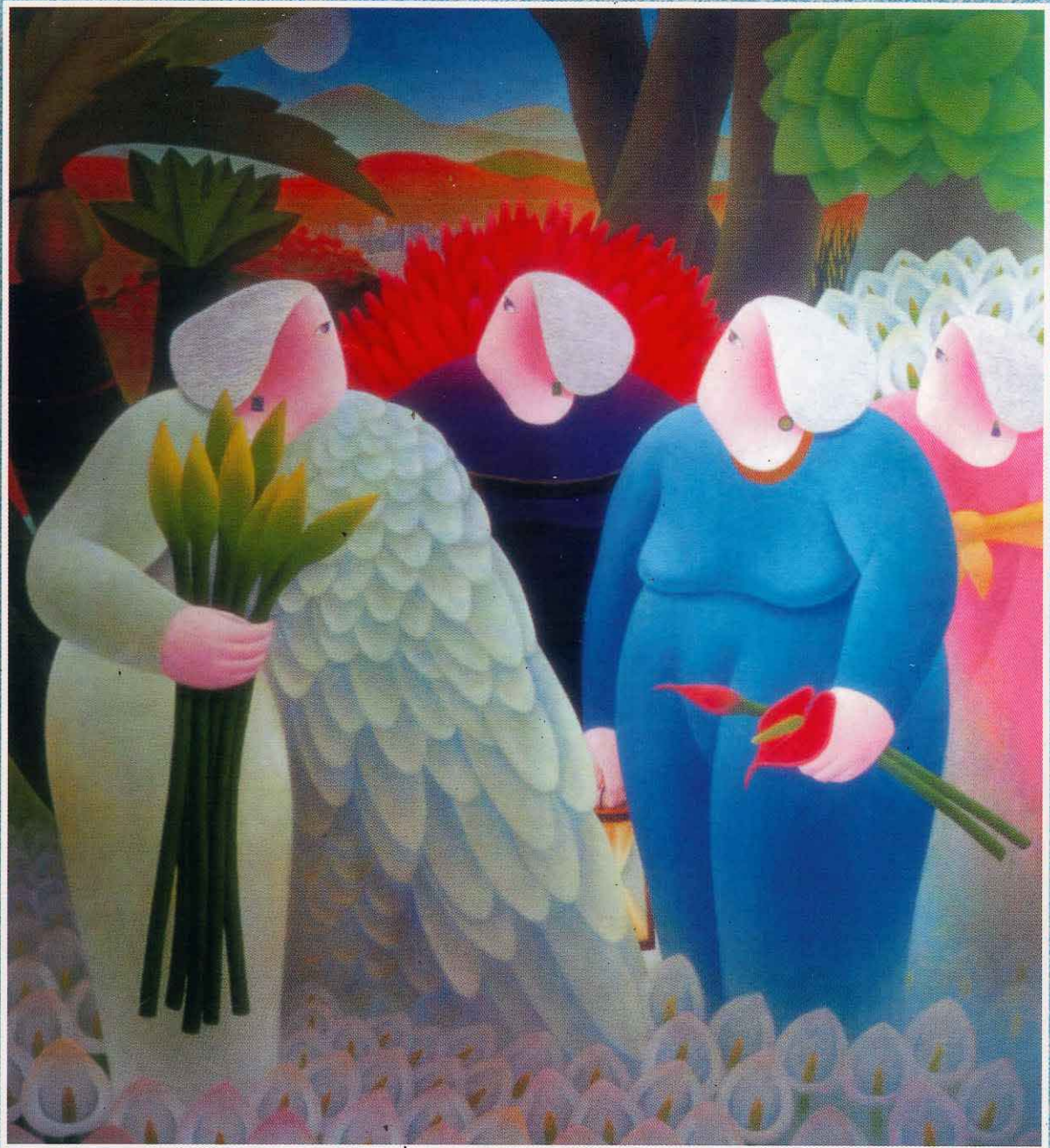
"Mítico" Antonio Caro